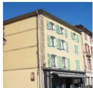
Sur un enduit ancien, le badigeon permet de façon économique d'unifier l'aspect d'une façade dans des tons naturels.

C'est une préparation à base de chaux (2 à 3 volumes d'eau pour 1 volume de chaux) parfois avec de l'alun (durcisseur) et un corps gras. Il est conseillé sur le bâti ancien et permet une coloration au choix sur un enduit à la chaux.